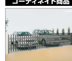
クレディアコー (▶住宅590)