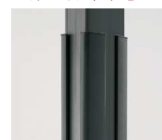
セイフティガードB (▶住宅543)