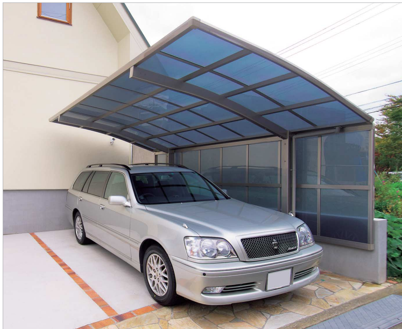
ステンカラー (2750サイズ)・サイドパネル (15サイズ)