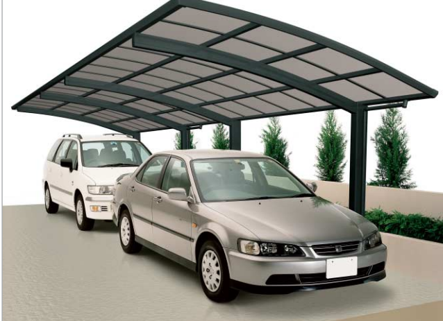
ニューセピアグレー (基本セット/2750サイズ+縦連棟ユニット/2750サイズ)