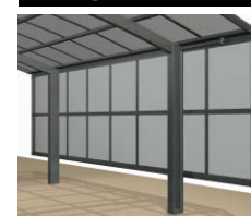
サイドパネル (▶住宅542)