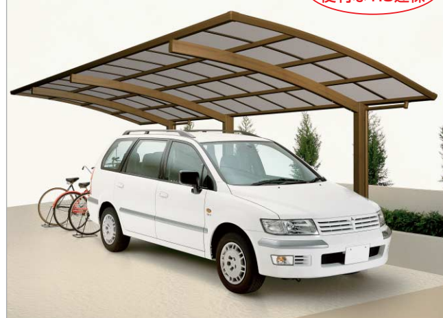
ブロンズ (基本セット/2750サイズ+延長ユニット/2725サイズ)