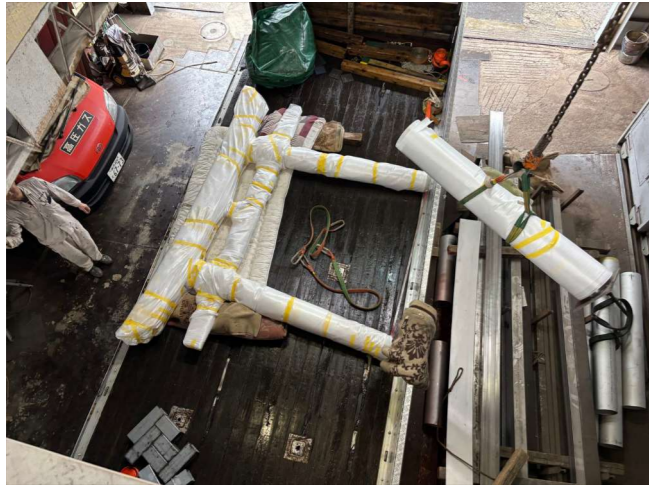
① 輸送：鳥居を積み込み