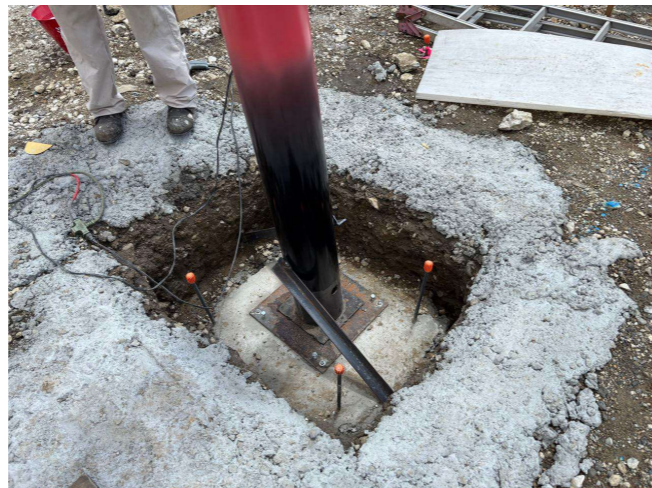
⑥ 水平と垂直をみて溶接