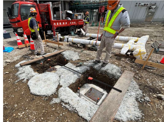
③ ベースプレートをアンカー固定