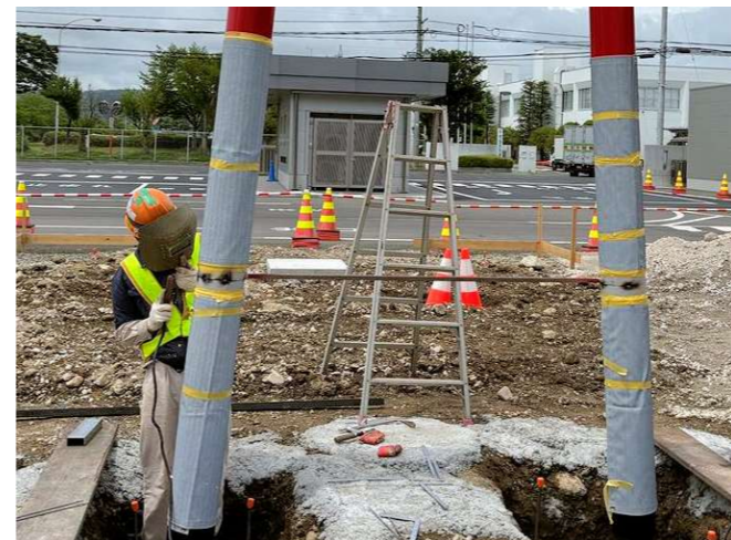
⑦ カンザシと柱の溶接完了