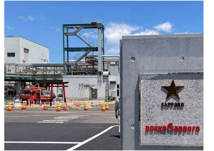
⑩ 完成 2