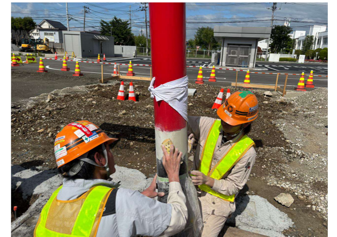
⑧ 溶接部の下地調整