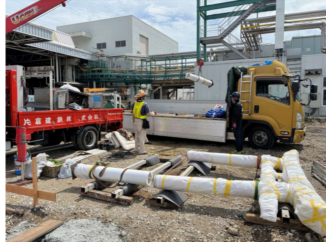
② 荷下ろし、組み立て